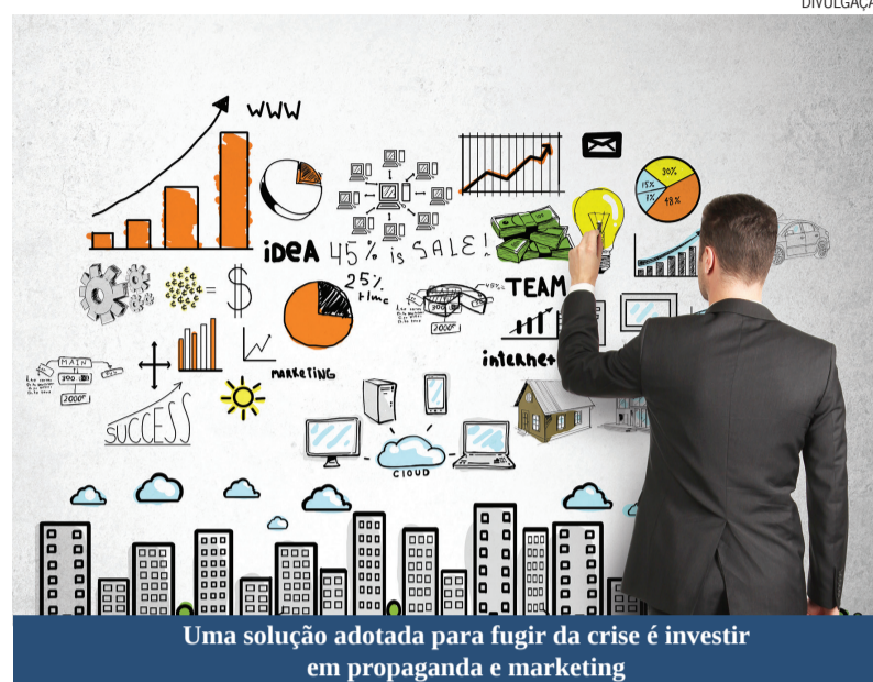
Uma solução adotada para fugir da crise é investir em propaganda e marketing

Como forma de ajudar o segmento a superar o momento