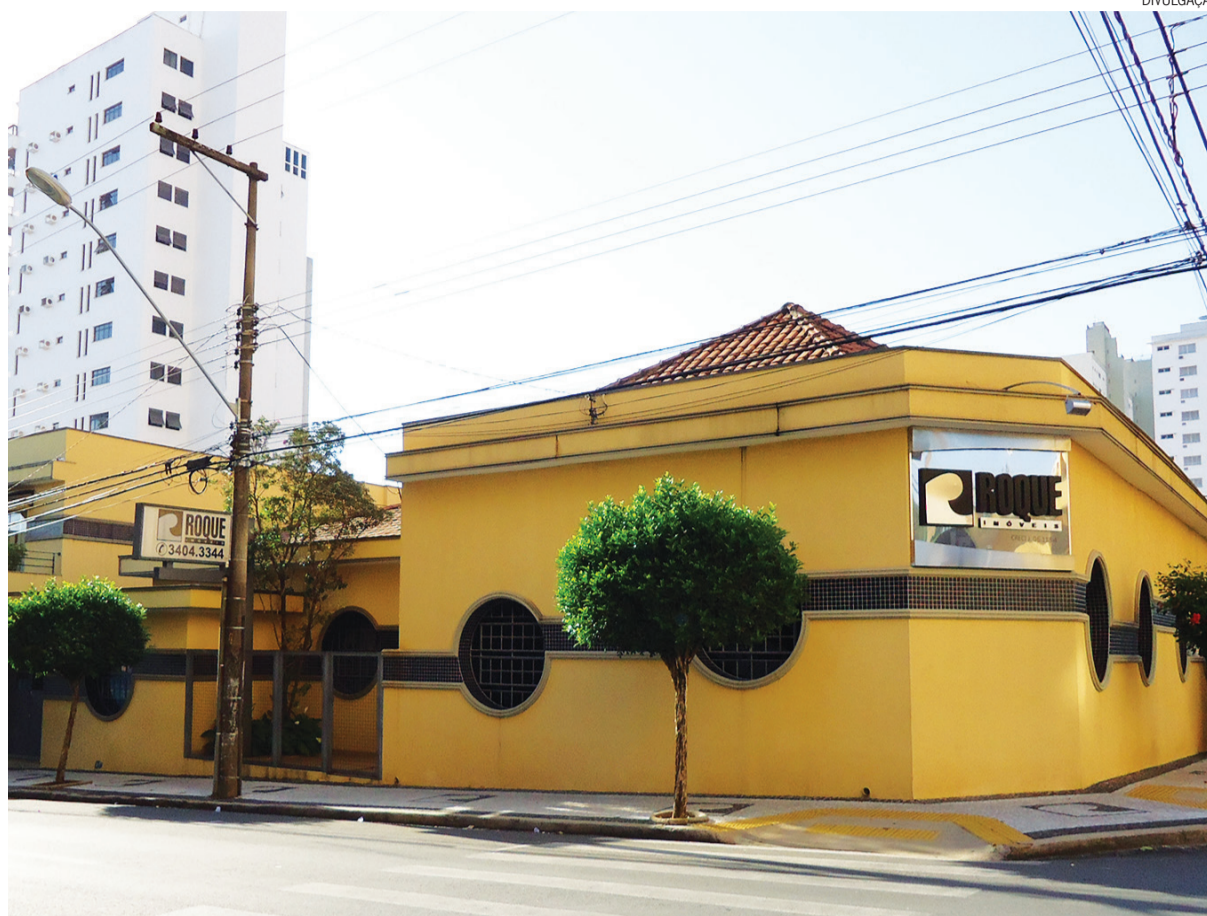
A Roque Imóveis é um dos empreendimentos que contribui com o desenvolvimento de Limeira

Além disso, Roque acredita no contínuo crescimento da cidade, sobretudo pela capacidade empreendedora do seu povo, especialmente na classe empresarial que se mantém extremamente envolvida com