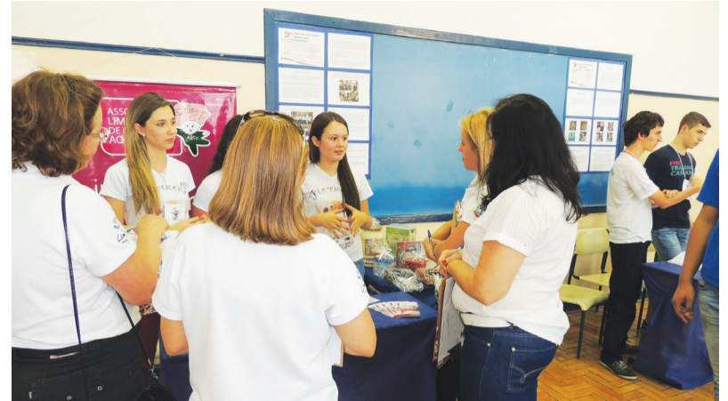
Na Feira de Projetos e Tecnologia é possível encontrar projetos das áreas de Pesquisa, Química, Meio Ambiente, Indústria, Gestão e Educação para Cidadania e Saúde

Comprovado pelo sucesso das antigas edições, a Etec Trajano Camargo já se prepara a 10ª Feira de Projetos e Tecnologia que acontece nos dias 23 e 24 de setembro na sede da instituição.