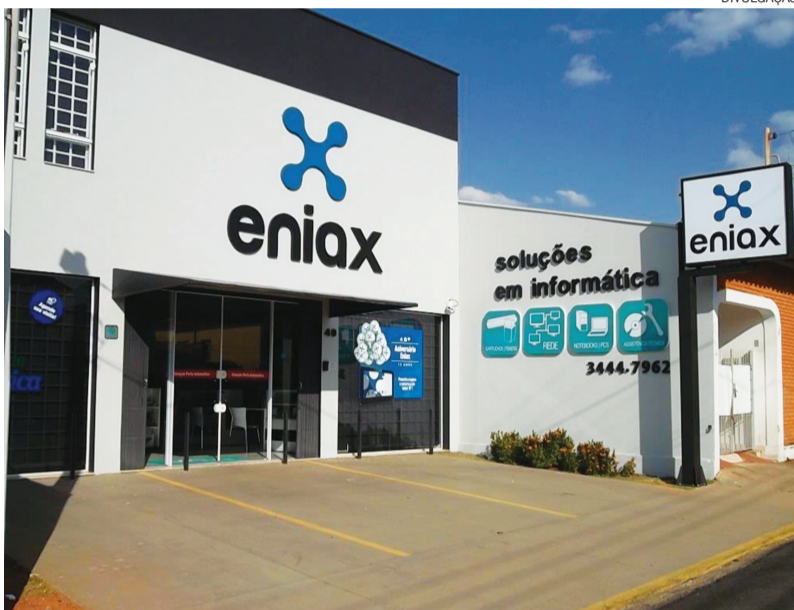
A Eniax comercializa produtos e serviços de informática que são referência de qualidade

O nome Eniax, veio a partir do primeiro computador a ser desenvolvido para fins militares. A marca aplicada no logotipo contempla em sua forma gráfica a representatividade da letra “X” que foi inserida ao nome para trazer modernidade e remeter a tecnologia. O “X” também representa multiplicação e prosperidade. O design do “X” buscou representar suas quatro pontas como células de rede e também os principais serviços da empresa: comercialização de produtos, assistência técnica, instalação de redes e suporte mensal, convergindo para o mesmo centro, a empresa.